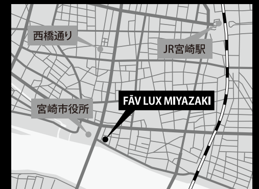
住所: 〒880-0805 宮崎県宮崎市橋通東1丁目2-24