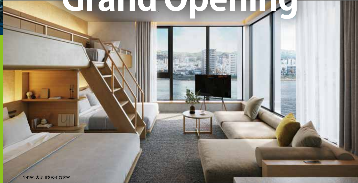
全41室。大淀川をのぞむ客室