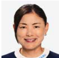
横峯 さくら Sakura Yokomine 1 1985年12月13日 2 鹿児島県 3 155cm 4 AB型 5 93位