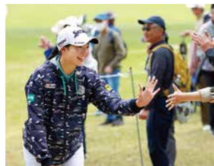
「ゴルフに楽しく向き合うことが子供たちには一番大事」という菅。大会コンセプト『みらいをつくろう』は、確実に受け継がれている。

ジュニア時代から切磋琢磨し合ってきた2人だけに、今大会のコンセプト『みらいをつくろう』について尋ねると、子供たちへの思いがあふれ出した。